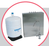
S-30 (タンク付タイプ) もあります。 定価: 200,000円