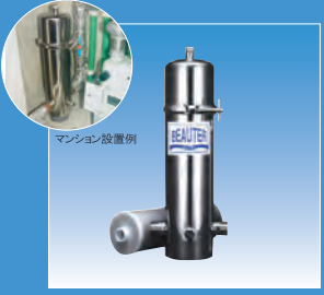
ビューター（マンション用）