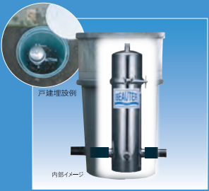
ビュータープラス（戸建埋設用）