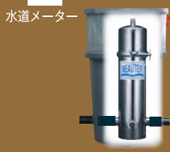
設置場所（ビュータープラス） ※上記設置場所は一例です。設置現場の状況により異なります。

お料理上手に！ 水道水で野菜を洗うと残留塩素でビタミン・ミネラルが破壊されるらしいのよ。でも浄水だからその心配もなくなったし、お米もふっくらと炊きあがり、水道水にくらべ、だし旨みも引き出してくれる。お義母さんにも「お料理の腕あげたんじゃない？」って言われちゃったわ。